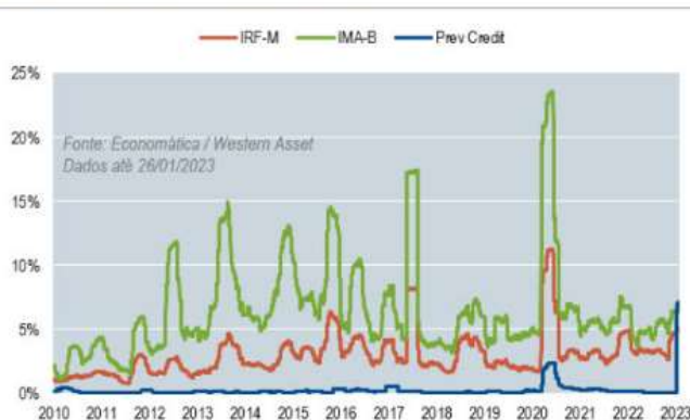
Exhibit 1: Volatilidade em janelas de 3 meses

O Segundo fato, foram os ataques antidemocráticos as sedes dos três poderes em Brasília. A rápida resposta do governo e ações tomadas para punição dos envolvidos acabou não gerando movimentos exagerados no mercado de capital local.